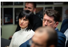
Krakowska premiera filmu dokumentalnego „Rakowiecka 37”.