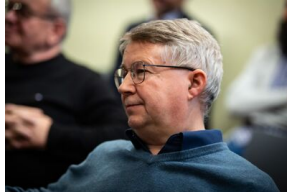
Krakowska premiera filmu dokumentalnego „Rakowiecka 37”.

W dawnej komunistycznej katowni, w której w czasach stalinowskich torturowano i mordowano największych polskich patriotów, a potem więziono działaczy opozycji politycznej w PRL, mieści się obecnie Muzeum Żołnierzy Wyklętych i Więźniów Politycznych PRL. Od marca 2022 r. organem prowadzącym tę placówkę jest Instytut Pamięci Narodowej, a samo muzeum nadal pozostaje w fazie organizacji. Sercem projektu są pawilony więzienne – X, w którym więziono bohaterów walk o niepodległość z lat 1945-1956 oraz XII, w którym przetrzymywano opozycjonistów z lat 70. i 80.