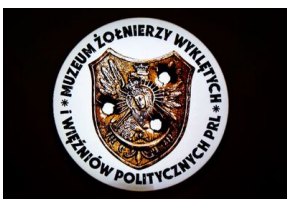
Krakowska premiera filmu dokumentalnego „Rakowiecka 37”.