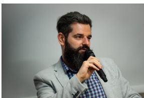
Krakowska premiera filmu dokumentalnego „Rakowiecka 37”.