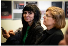
Krakowska premiera filmu dokumentalnego „Rakowiecka 37”.