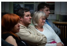
Krakowska premiera filmu dokumentalnego „Rakowiecka 37”.