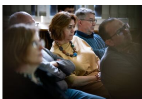
Krakowska premiera filmu dokumentalnego „Rakowiecka 37”.