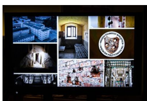
Krakowska premiera filmu dokumentalnego „Rakowiecka 37”.

18 kwietnia 2024 r. w Centrum Edukacyjnym „Przystanek Historia” IPN w Krakowie odbyła się krakowska premiera filmu dokumentalnego pt. „Rakowiecka 37. Historia więzienia i aresztu śledczego Warszawa-Mokotów”.