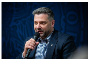
Krakowska premiera filmu dokumentalnego „Rakowiecka 37”.