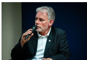
Krakowska premiera filmu dokumentalnego „Rakowiecka 37”.