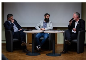
Krakowska premiera filmu dokumentalnego „Rakowiecka 37”.