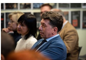
Krakowska premiera filmu dokumentalnego „Rakowiecka 37”.