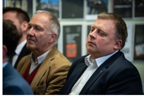
Krakowska premiera filmu dokumentalnego „Rakowiecka 37”.